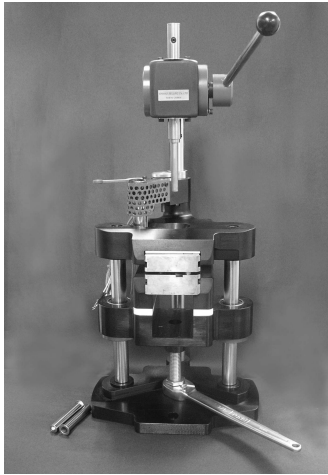
図1 全手動式射出成形機【ハンディトライ】

の長さで決まるが、しょせん手動であるがゆえ、本機の射出圧力 ( 300 \text{ kgf/cm}^2 ) は通常成形機の射出圧力 ( 2,000 \text{ kgf/cm}^2 ~) の7% 前後と極端に低い。そのような成形機でも成形を可能にするには、いかにして「射出衝撃を吸収させない」かが重要であり、図2の成形品 (PP) をもって検証した。