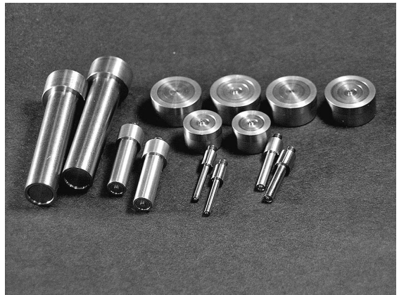
図2 負圧ストロークガスバンド【St ベンド】