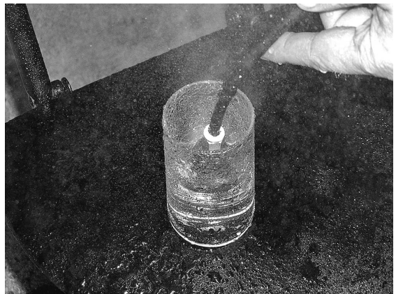
図3 ワンタッチ負圧発生装置【ガスバルブ】

が、数年前より新たな案件に取り組んでいる。ウェルド部対面に【St ベンド】を埋め込み、熱媒体を送り込み部分的に金型の表面温度だけを上げようとするもの。ウェルド解消、転写性の向上と評価の高い「ヒート&クール」と同等の機能を期待している。完成すれば開発番号 71 号となる。